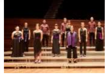
CORO JUVENIL ÁNGEL BARJA