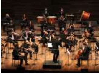
BANDA DE MÚSICA JJMM-ULE