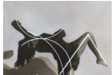
AULA DE ARTES DEL CUERPO